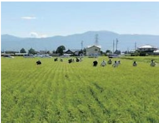
出穂期の抜き取り

畦間・株間がこのような状態になっていませんか？。 (放置したり除草剤で失敗すると、このようなことにも・・・)